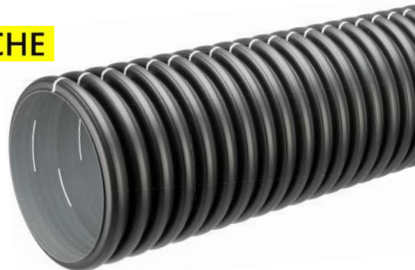
Multifunctionele buis (MP)